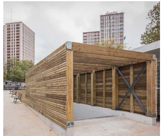
La nouvelle sortie de secours est en bois brut pour s'intégrer au square

Dans cette station, les accès existants étaient suffisants pour absorber l'augmentation du nombre de voyageurs. Seule une issue de secours supplémentaire a été créée près de l'actuelle sortie Place des Fêtes. Le chantier est en partie situé sur le square Monseigneur Maillot où plusieurs arbres ont été retirés mais seront replantés après la fin du chantier. Le gros oeuvre s'achève décembre, reste le second oeuvre (électricité, carrelage...).