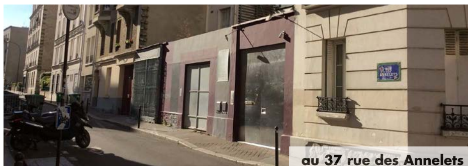
au 37 rue des Annelets

Ce studio a été remplacé en 2009 par les prestigieux studios d'enregistrement Talk Over qui viennent à leur tour de fermer. Ces derniers avaient été ouverts par Redha Zaïm qui y avait développé le design sonore, les enregistrements de musique et de voix pour