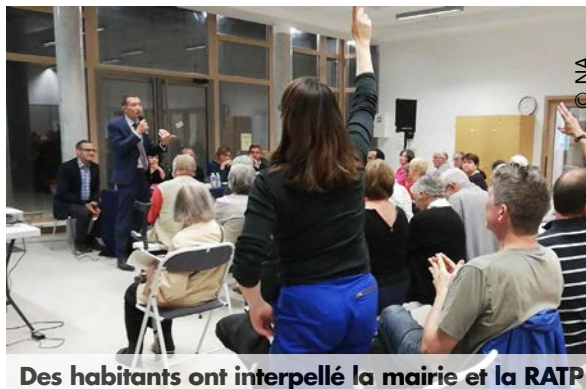
Des habitants ont interpellé la mairie et la RATP

En amont, une réunion d'information s'était tenue au cinéma l'Étoile des Lilas pour les habitants du quartier. Et sa copropriété est en relation avec la RATP, à qui elle a pu faire entendre certaines préoccupations. « Ils ont été réactifs quand à la sécurisation de l'accès à la grue