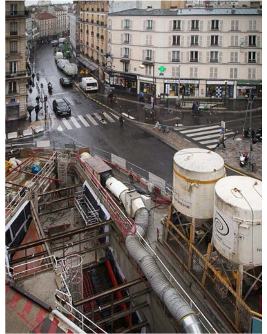
À Jourdain, le puits est profond de 18 m

De nouveaux couloirs et escaliers vont être créés dans cette station pour pouvoir sortir depuis l'autre extrémité du quai. Même en heure de pointe, tous les voyageurs doivent pouvoir évacuer en 10 minutes en cas de problème. Les travaux sont réalisés en partie à ciel ouvert : un énorme trou (dans lequel notre équipe s'est risquée !) permet de descendre matériaux et machines et d'évacuer les gravats. Vous avez sans doute remarqué l'imposante grue qui rivalise avec la flèche de l'église ! L'emprise du chantier s'étend sur les trottoirs et une partie de la chaussée, sans oublier la base vie rue de Palestine, à cheval sur les espaces de stationnement et le trottoir.