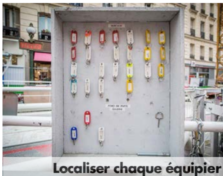
Localiser chaque équipier

« Sous terre, on est obligé de se faire confiance entre nous, notre vie dépend de nos coéquipiers. Cela crée une forte solidarité, une ambiance très humaine »,